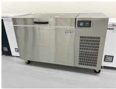
-120℃ディープフリーザー