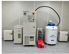
液体窒素発生装置/ 液体窒素保管容器