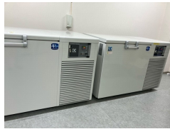
-150℃ディープフリーザー