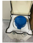
液体窒素輸送容器 (ドライシッパー)