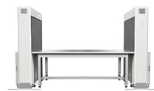
オープンクリーンベンチ KOACH C 900-F