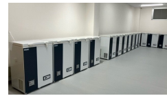
-80℃ディープフリーザー