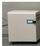
バックアップ対応 リチウムイオン電池 (24時間)