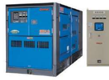
自家発電機 全館対応 (72時間)