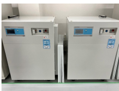
長時間バックアップ対応 無停電電源装置 (100時間)