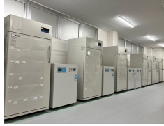
-20℃ディープフリーザー